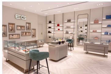
مرکز تجاری دومان