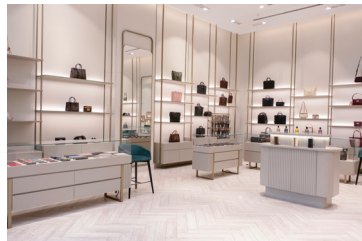
بوتیک مال ملل