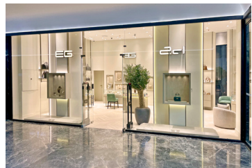
مرکز تجاری بین پلازا شیراز