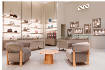
مرکز تجاری اهل